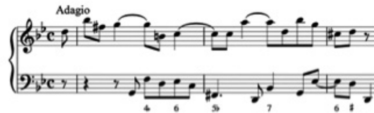
Inicio del primer movimiento de la sonata para oboe, H.549 de C.P.E. Bach

El primer movimiento Adagio , en sol menor, de carácter lento y expresivo, se nos muestra ortodoxo en cuanto a su planteamiento armónico, construido a partir de una sucesión de modulaciones a tonalidades vecinas mediante acordes puente. En el trabajo melódico, el joven C.P.E. Bach emplea recurrentemente los intervalos de sexta y segunda menores con característicos motivos sincopados, finalizando en una cadencia no escrita que el compositor deja a la libertad del intérprete, como era habitual en la época.