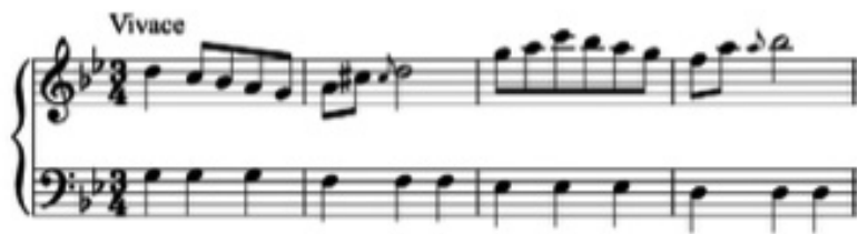
Tema del tercer movimiento de la sonata para oboe, H.549 de C.P.E. Bach

La de André Previn (Berlín, 6 de abril de 1929 - Nueva York, 28 de febrero de 2019) fue una vida en constante movimiento desde su infancia, ya que el origen judío de su familia les obligó a trasladarse a París desde su Berlín natal y posteriormente a Los Ángeles, donde se establecerían. Esa tendencia al movimiento le acompañaría siempre, transitando estilísticamente de la clásica al jazz pasando por la música para cine; desplazándose igualmente por las diversas facetas de su brillante carrera musical como director de orquesta, compositor, pianista y docente, cosechando grandes éxitos: cuatro premios Oscar por su música para las películas Gigi (1958), Porgy and Bess (1959), Irma la dulce (1963) y My Fair Lady (1964); director musical de orquestas tan prestigiosas como la Sinfónica de Londres, Filarmónica de Los Ángeles y Royal Philharmonic Orchestra . Tras esta vertiginosa carrera, en la década de 1990 comenzó a dedicar más tiempo a la composición, dando lugar a un corpus de obras que incluye numerosos conciertos, dos óperas ( Un tranvía llamado deseo y Breve encuentro ) y numerosas obras de cámara, entre ellas su Trío para oboe, fagot y piano , compuesto en 1994 y estrenado dos años después.