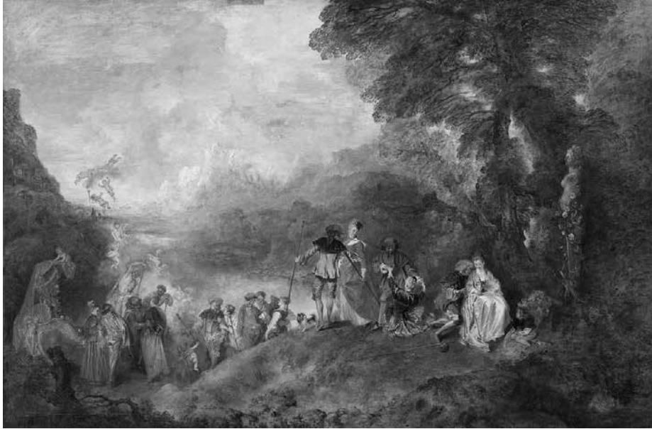
Pèlerinage à l'île de Cythère , Jean-Antoine Watteau (1717)

la diosa del amor. El principio de la partitura señala quasi una cadenza y es de gran dificultad interpretativa, ya que discurre a velocidad de vértigo con la escala de tonos enteros, la escala diatónica y el modo lidio, que actúa de nexo entre las dos escalas.